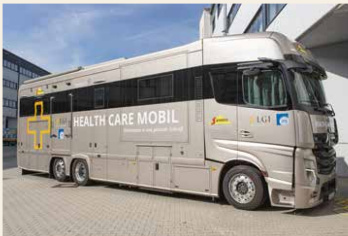
LGI och ITG lanserade en gemensam företagshälsövårdsbil under 2021.

Under 2021 har medarbetares hälsa och säkerhet fortsatt varit i fokus mot bakgrund av rådande pandemi. Förebyggande åtgärder inkluderar arbete hemifrån för de anställda där detta är möjligt, temperaturmätning innan tillträde till anläggningar och kontor för både medarbetare och gäster, minimering av resor och företrädesvis digitala möten. Elanders dotterföretag LGI och ITG lanserade även en gemensam företagshälsövårdsbil där de anställda på frivillig basis erbjöds att vaccinera sig mot covid-19. Efter denna vaccinationskampanj kommer lastbilen att bli en integrerad del av företagshälsövården och användas till andra vårduppgifter när besök görs på de olika enheterna. Tillsammans med de andra åtgärder som har vidtagits hittills är detta ytterligare en milstolpe som bidrar till att bekämpa coronapandemin och att skydda hälsan hos de anställda inom koncernen.